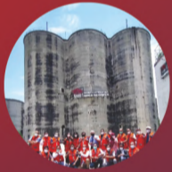
ALIH FUNGSI PABRIK MENJADI KAMPUS