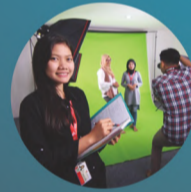
LAB AUDIO VISUAL